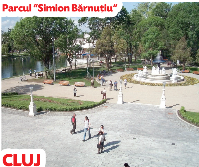
Parcul "Simion Bărnuțiu"

Decembrie 2015 este termenul limită pentru finalizarea proiectelor finanțate cu bani europeni nerambursabili din cadrul Programului Operațional Regional ▼ Iașul, alături de alte 6 orașe din țară, a fost pol de creștere ▼ La noi, grosul banilor s-a dus în infrastructură, pe proiecte culturale sau sociale ▼ Dar Brașovul, Clujul, Craiova, Timișoara pe ce au cheltuit banii? ▼ I-au folosit mai inteligent ca noi?