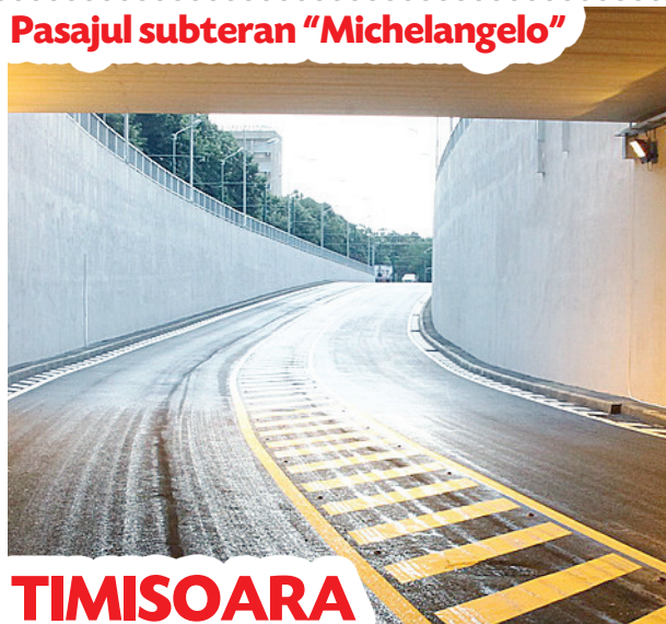
Pasajul subteran "Michelangelo"