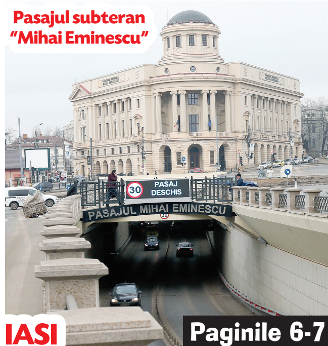
Pasajul subteran "Mihai Eminescu"